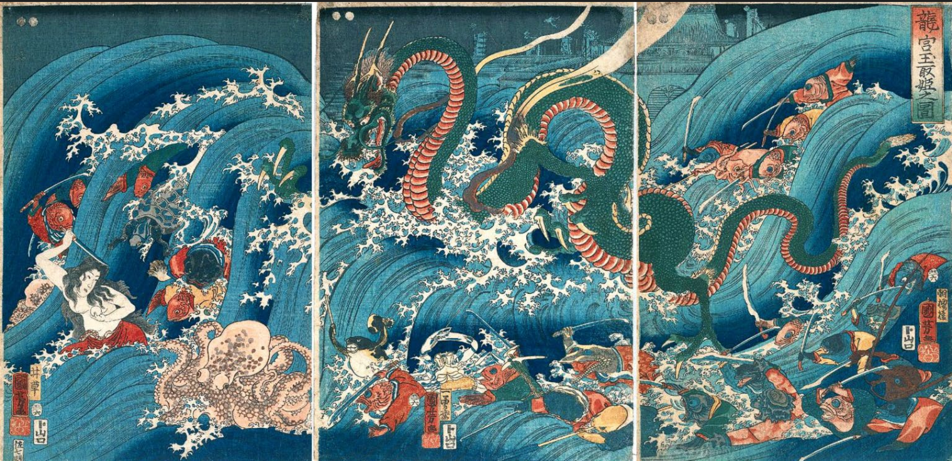
“The Princess Jewel Taker at the Dragon Palace” by Utagawa Kuniyoshi (1798-1861)

License Creative Commons CC0 1.0 Universal Public Domain Dedication.